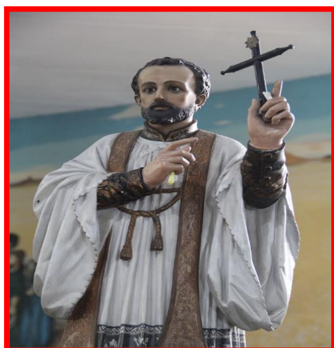
São Francisco Xavier